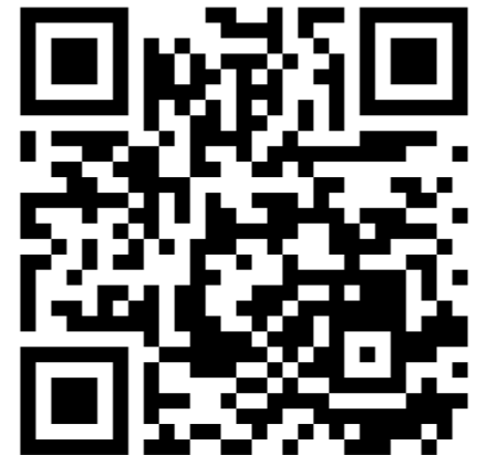
N generation Registration page

Go to the registration screen from the above online registration URL.