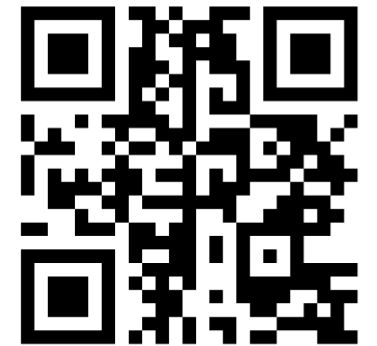
N generation Home page

Visit the homepage of Ngeneration Inc. → https://n-generation.life/